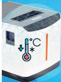
Printhead overheating protection control